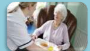
Préparation et service des repas