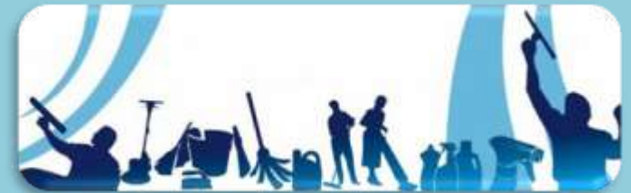
Entretien des espaces de vie