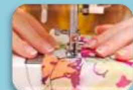
Entretien du linge et des vêtements